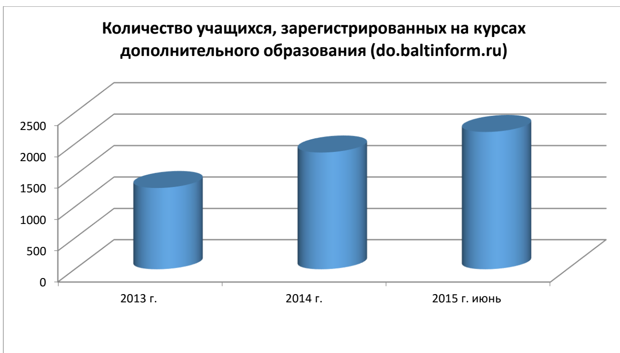
Рис 6. Количество учащихся, зарегистрированных на курсах дополнительного образования

В целях распространения опыта по внедрению дистанционного обучения в такие сферы как дошкольное образование Калининградским областным институтом развития образования была организована встреча с представителями МАДОУ детский сад №59. Участники встречи обсудили проблемы и перспективы развития дистанционного обучения в дошкольном образовании в регионе. Воспитателям и администрации было предложена стратегия внедрения дистанционных образовательных технологий в воспитательный процесс, организация работы с родителями с учетом особенностей данной области образования. Также для диссеминации накопленного в регионе опыта по использованию дистанционных образовательных технологий Институтом запланировано мероприятие по изданию сборника методических разработок в сфере дистанционного обучения - учитывая меняющиеся условия социальной среды и преобразования российского дистанционного образования целесообразно говорить о необходимости ежегодного сбора информации и научных статей, структурирование уже имеющихся учебно-методических материалов и