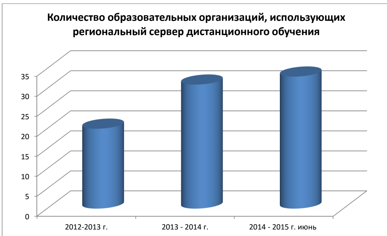
Рис 5. Количество образовательных организаций, использующих региональный сервер дистанционного обучения.

В рамках сотрудничества Института развития образования с образовательными организациями области проводилась аналитическая работа по качественному и количественному анализу пользователей регионального сервера дистанционного обучения do.baltinform.ru (Рисунок 1). Для образовательных организаций заведена в рамках заключенных договоров своя «площадка», на которой педагоги создают свои дистанционные курсы по программам общего и дополнительного образования, обучают на них или на уже имеющихся дистанционных курсах зарегистрированных пользователей. Принимая во внимание увеличение роста пользователей, говорит о востребованности данного ресурса (Рисунок 2). Существенно расширился список разрабатываемых курсов с учетом потребностей обучающихся и приоритетными направлениями Калининградской области.